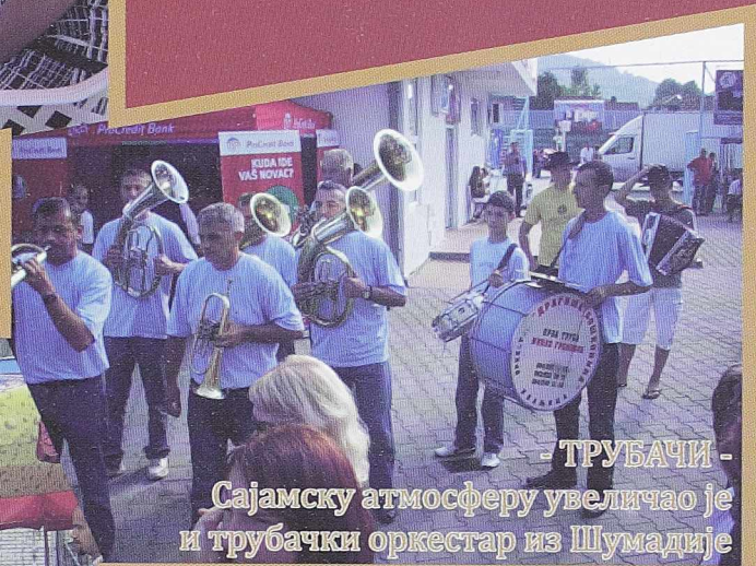
- ТРУБАЧИ - Сајамску атмосферу увеличао је и трубачки оркестар из Шумадије