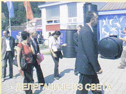
- ДЕЛЕГАЦИЈЕ ИЗ СВЕТА -