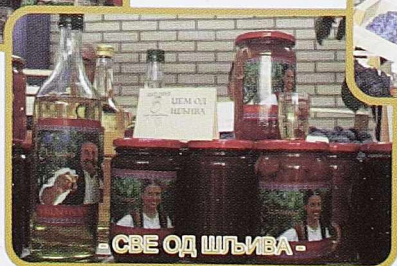
- СВЕ ОД ШЉИВА -