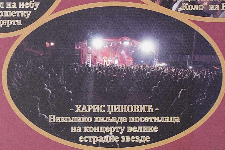
- ХАРИС ЦИНОВИЋ - Неколико хиљада посетилаца на концерту велике естрадне звезде