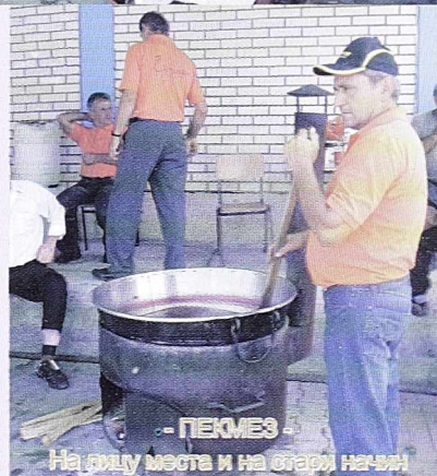
- ПЕКМЕЗ - На месту места и на стари начини