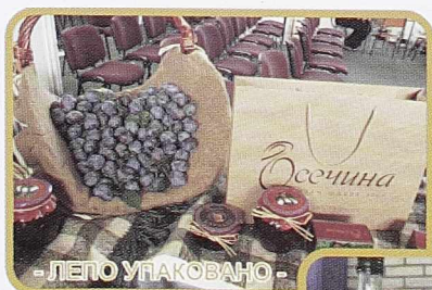
- ЛЕПО УПАКОВАНО -