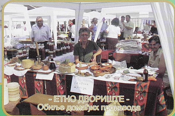
- ЕТНО ДВОРИШТЕ - Обиље домаћих производа