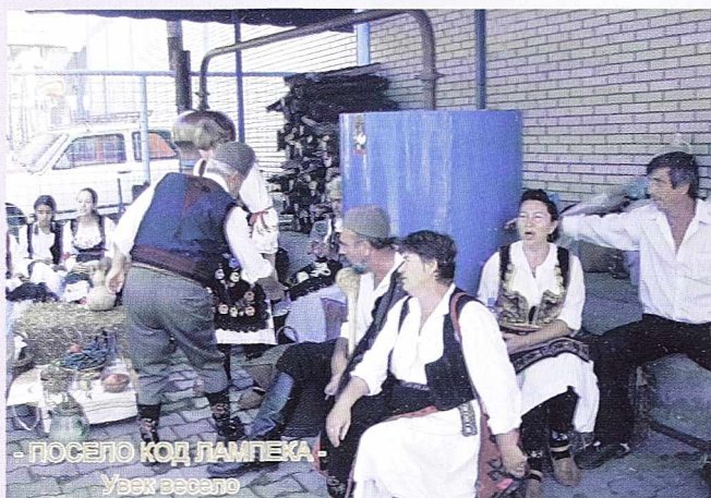
- ПОСЕЛО КОД ЛАМПЕКА - Увек весело