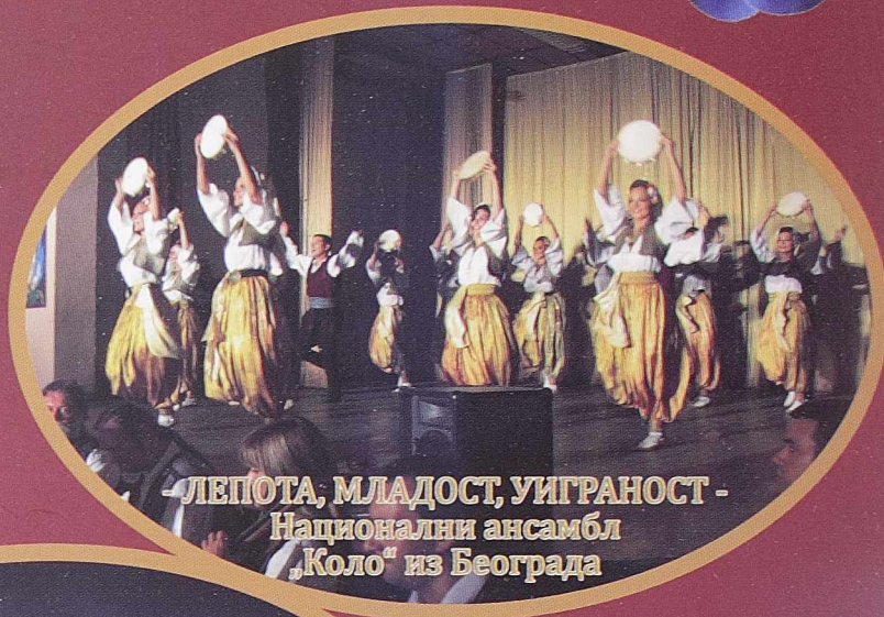
- ЛЕПОТА, МЛАДОСТ, УИГРАНОСТ - Национални ансамбл „Коло“ из Београда