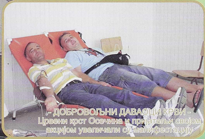
- ДОБРОВОЉНИ ДАВАОЦИ КРВИ - Црвени крст Осечина и пријатељи својом акцијом увеличали су манифестацију