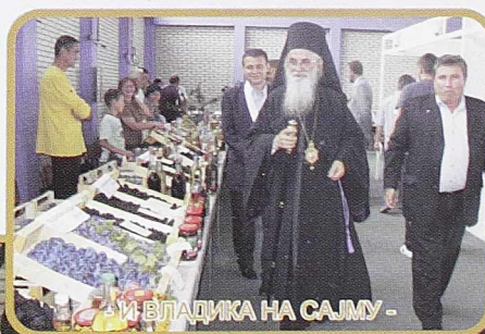
- И ВЛАДИКА НА САЈМУ -