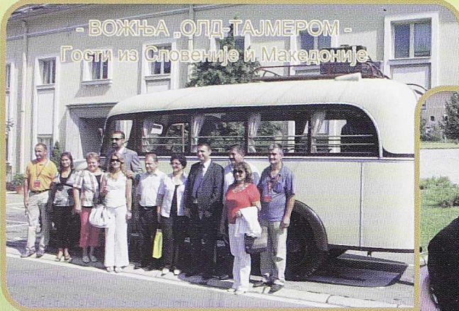
- ВОЖЊА „ОЛД-ТАЈМЕРОМ“ - Гости из Словеније и Македоније