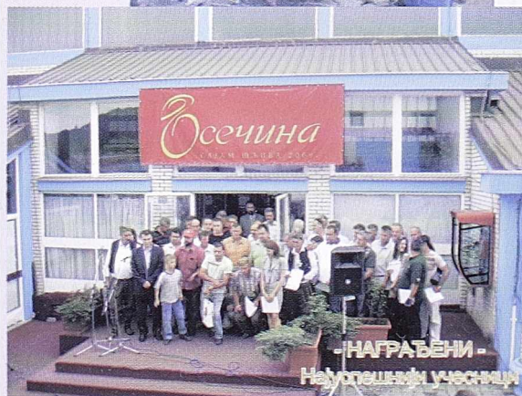
- НАГРАЂЕНИ - На успешнији учесници