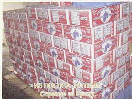
- ИЗ ПОГОНА „ИНТЕМА” Сремне за Русију