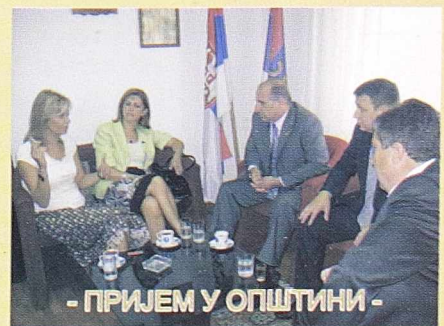
- ПРИЈЕМ У ОПШТИНИ -