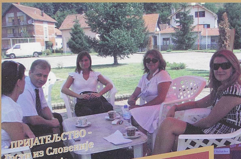
- ПРИЈАТЕЉСТВО - Гости из Словеније и Македоније