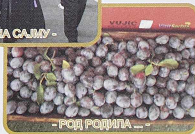
- РОД РОДИЛА -