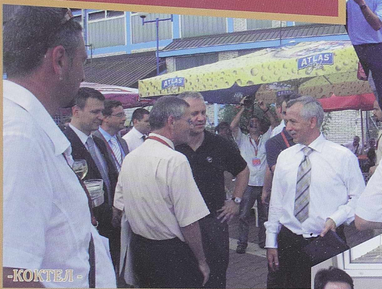
- КОКТЕЛ -