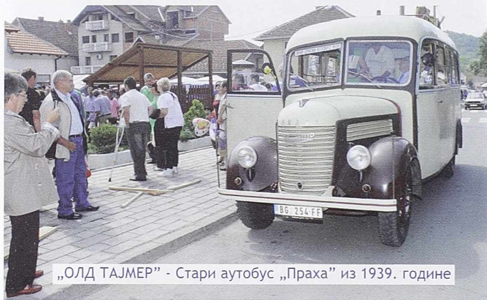
„ОЛД ТАЈМЕР“ - Стари аутобус „Праха“ из 1939. године

Организован је излет „Тешманов конак“, комбинација панорамског разгледања Осечине и њене околине, али и лагане шетње кроз село Бастав до Тешмановог конака, комплекса аутентичних зграда из прве половине 19. века, које су добро очуване и још су у употреби. Оне се налазе се под заштитом државе као културно добро од велике важности. Представљају не само споменик градитељства и начина живота једног доба него и споменик стварања модерне српске државе. У пратњи туриста били су туристичких водичи - млади сајамски волонтери из Осечине и околине, што је једна од сајамских новина.