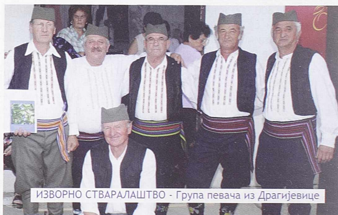
ИЗВОРНО СТВАРАЛАШТВО - Група певача из Драгијевице