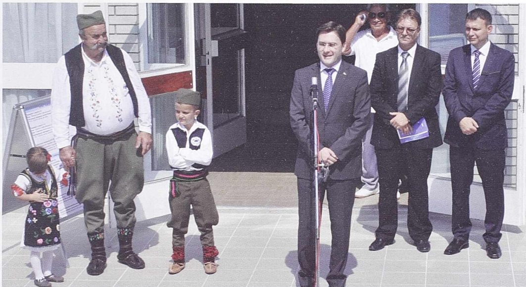
СВЕЧАНО ОТВАРАЊЕ - Министар Никола Селаковић

И овог пута успешни организатори манифестације у част најраспрострањеније воћарске културе били су Општина