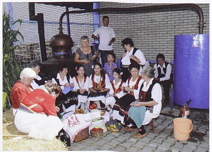
НЕГОВАЊЕ БАШТИНЕ - Посело код лампека