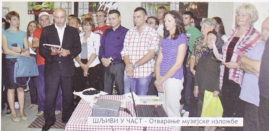
ШЉИВИ У ЧАСТ - Отварање музејске изложбе

Изложба „Шљива - симбол Подгорине“ је својеврсна пред-прича, односно на неки начин увод, у будући „Први српски музеј шљиве“, који ће бити отворен баш у Осечини. Са њим би се цела прича о шљиви и Подгорини објединила, а трајање Сајма шљива са три дана продужило на свих 365 или 366 дана годишње.