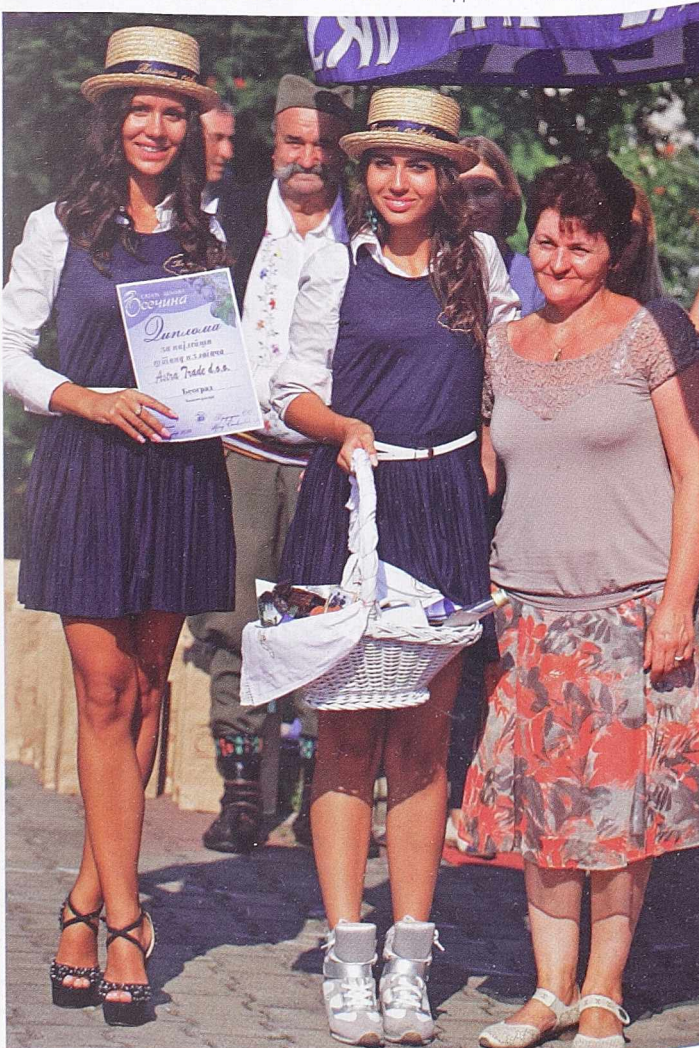
„ОСЕЧАНСКА КОРПА“ - Представнице „Аста траде“ са Станицом Чворић

„ФМП Агромеханика“ константно шири своје тржиште, а тренутно је присутна у: Србији, Босни и Херцеговини, Хрватској, Македонији, Црној Гори, Словенији, Грчка, Бугарска, Румунија, Белгија, Мађарска, Словачка, Немачка, Алжир, Мароко, Бангладеш, Украјина, Русија и републике бившег СССР-а.