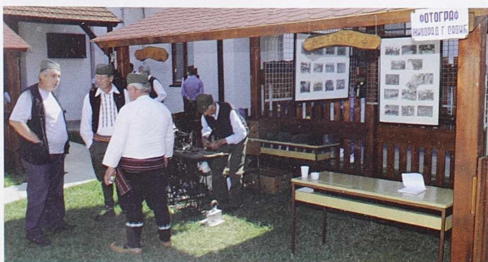
На „Тргу старих заната”