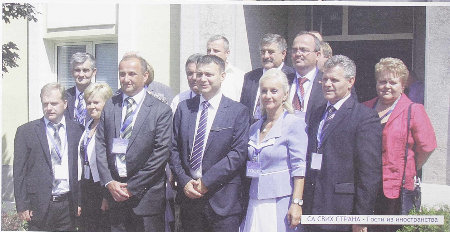
СА СВИХ СТРАНА - Гости из иностранства