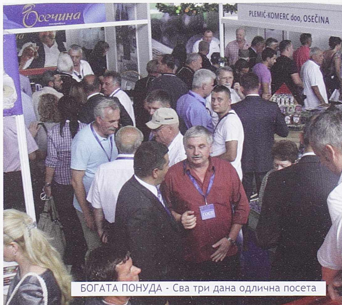
БОГАТА ПОНУДА - Сва три дана одлична посета

Компанија „Агромаркет” је један од водећих снабдевача тржишта Србије пестицидима (преко 25 одсто). Највећи добав-