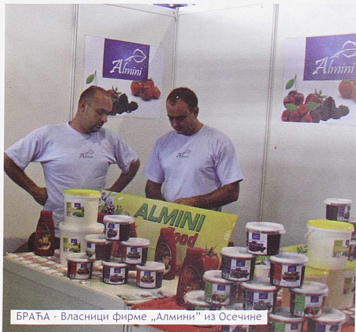
БРАЋА - Власници фирме „Алмини“ из Осечине

- Осечина је у свему добар домаћин, а Сајам шљива је манифестација вредна сваке пажње!