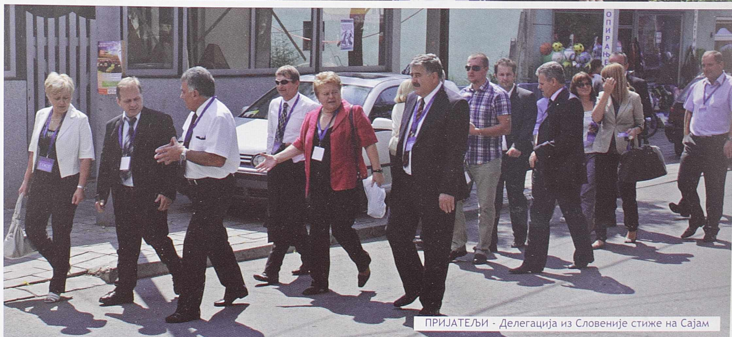
ПРИЈАТЕЉИ - Делегација из Словеније стиже на Сајам