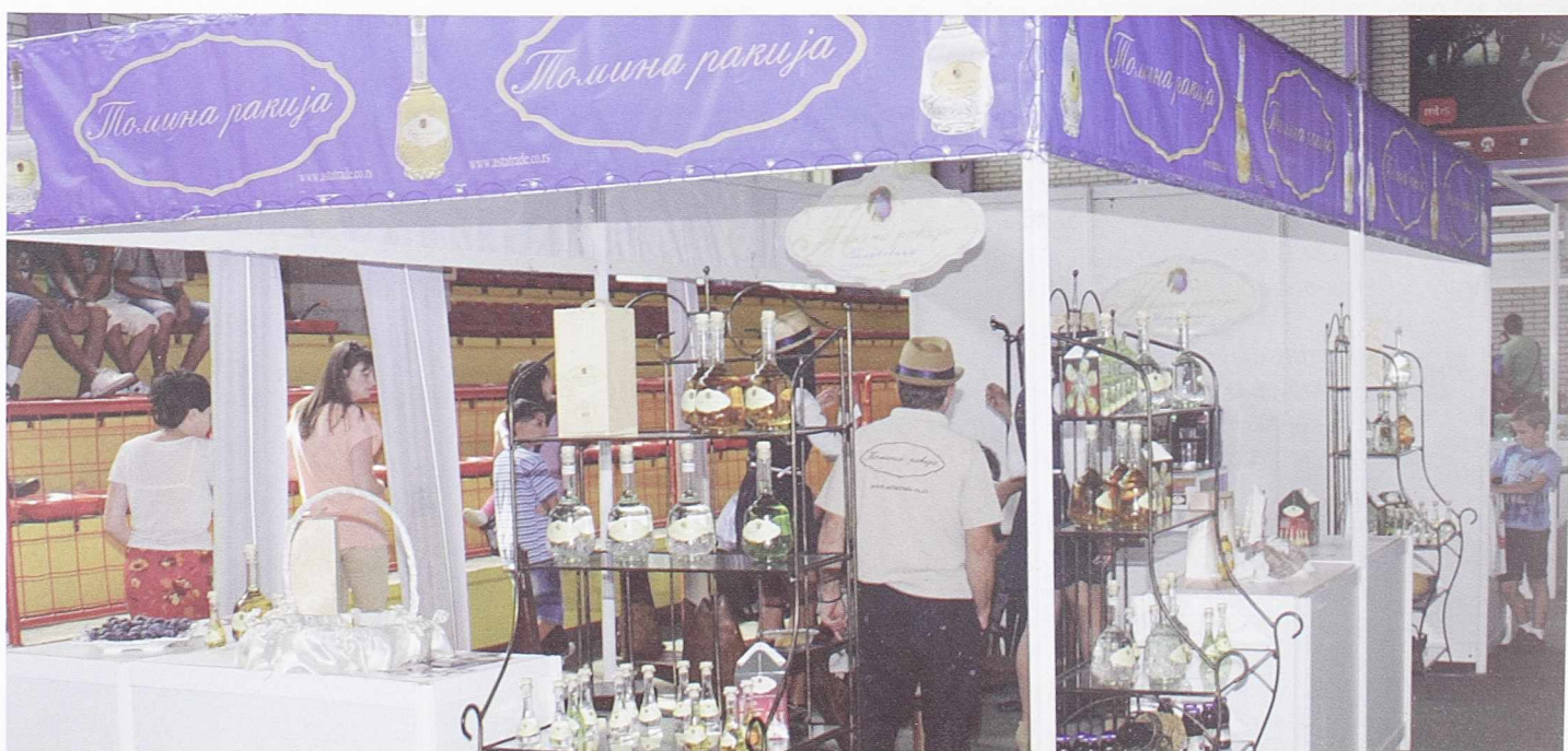
У конкуренцији за најлепши штанд излагача награду „Осечанска корпа“, освојила је фирма „Аста trade“ доо из Београда („Томина ракија“).