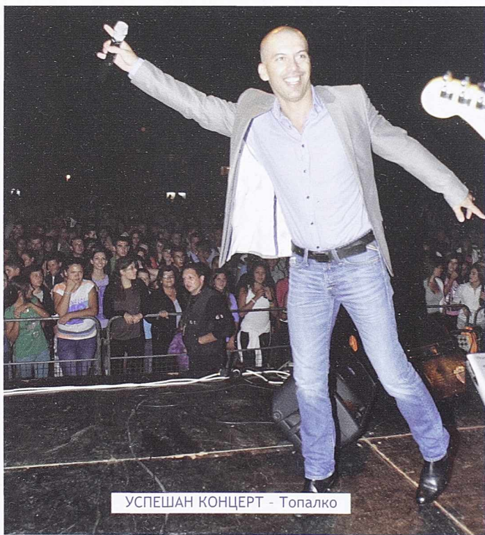
УСПЕШАН КОНЦЕРТ - Топалко

Заједничко за све концерте је то да сви били добро посећени, а атмосфера на њима изванредна. Томе су, свакако, допринеле приступачне цене улазница и одлука организатора да за децу, госте, излагаче и учеснике свих сајамских дешавања улаз буде бесплатан, што је уз сву популарност и атрактивност извођача, омогућило да све три ноћи у богатом музичком програму ужива по неколико хиљада људи.