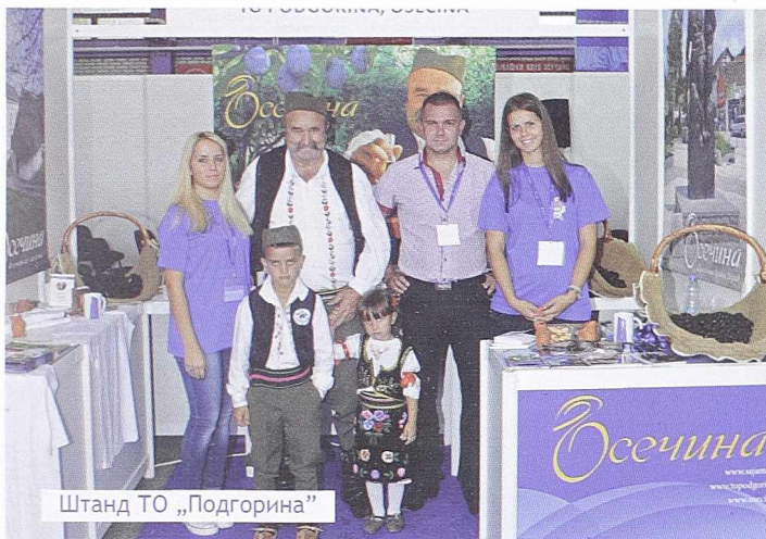
Штанд ТО „Подгорина“

У оквиру богатог програма за туристе у успешној реализацији од стране Туристичке организације „Подгорина“, уприличено је панорамско разгледање Осечине. Дух старих времена је оно што је обележило ове обиласке.