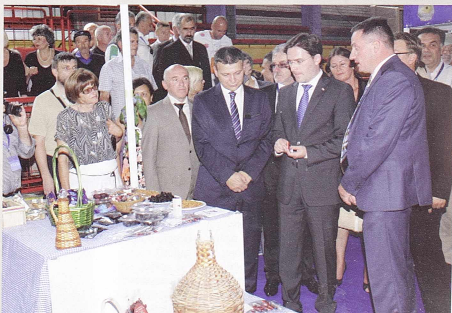
ПРЕРАДА ВОЋНИХ И ШУМСКИХ ПРОИЗВОДА-Компанија „Племић - комерц”