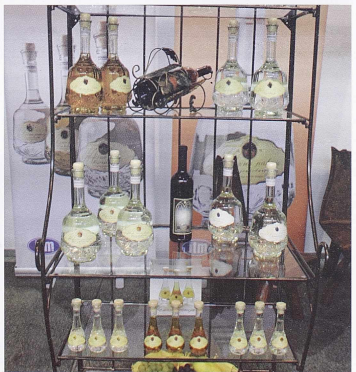
РАЗНЕ РАКИЈЕ - За пиће и - поклон