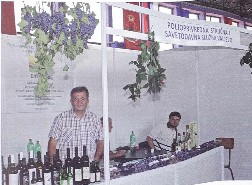
НАЈБОЉИ У СРБИЈИ - Штанд ПССС Ваљево

Ова служба врши пружање бесплатних препорука и савета за 285 одабраних газдинстава, као и осталим заинтересованим лицима. Изводи огледа у биљној и сточарској производњи у циљу увођења новог сортимента и расног састава. Организује предавања, радионице, саветовања и семинара, као и стручне манифестације у пољопривреди.