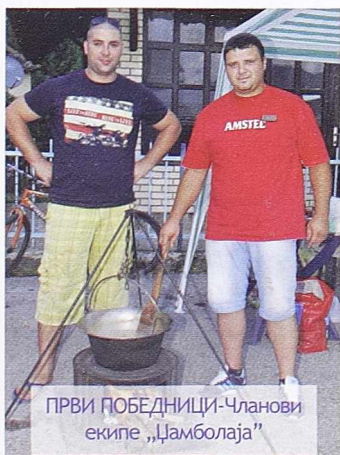
ПРВИ ПОБЕДНИЦИ-Чланови екипе „Џамболаја“

Судећи по показаном интересовању учесника и исказаном задовољству публике слободно се може констатовати да су кроз одржавање такмичења у справљању гулаша у котлићима, као и кроз наступ витезова овом приликом устројени нови незаобилазни садржаји за наредне сајамске манифестације.