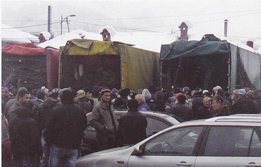
ДОСТА ЗАИНТЕРЕСОВАНИХ - Са овогодишње поделе регресираних садница

- На самим произвођачима је да одлуче о сортименту и нивоу технологије гајења. У складу са тим ће постићи одговарајуће резултате. Воћар који хоће да се мало више удуби у избор сорти и посвети више пажње технологији гајења, да произведе квалитет какав тржиште захтева, свакако ће постићи значајно бољу цену.