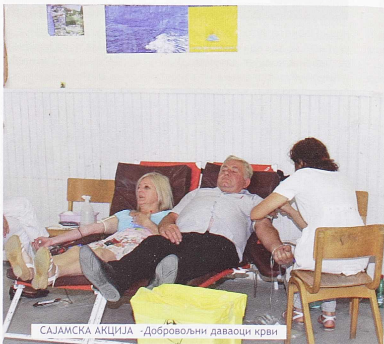
САЈАМСКА АКЦИЈА -Добровољни даваоци крви

Добровољни даваоци драгоцене течности, у организацији Црвеног крста Осечине, и на осмог Сајму у великом броју прикључили су се акцији обезбеђења крви за најугроженије. Хуманост на делу показали су вишеструки редовни даваоци из редова гостију, излагача и учесника Сајма, као и многобројни мештани. По завршетку акције уследило је традиционално дружење давалаца.