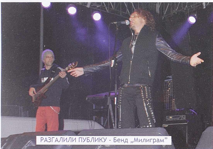
РАЗГАЛИЛИ ПУБЛИКУ - Бенд „Милиграм“

У вечери након свечаног отварања Сајма концертни подијум запосели су чланови бенда „Милиграм“. Наступили су са широким репертоаром својих песама или веома коректним интерпретирањем најпознатијих хитова других извођача. Публика, макар једнако бројна као на претходном концерту, уживала је у свакој изведеној нумери, награђујући популарне музичаре салвама аплауза и овацијама.