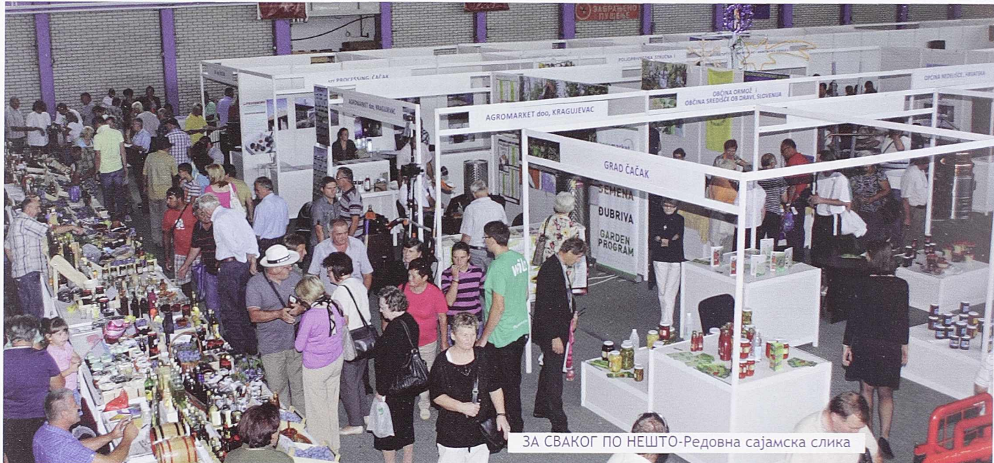
ЗА СВАКОГ ПО НЕШТО-Редовна сајамска слика

Излагачи и гости из региона једнодушни су у оцени да је и