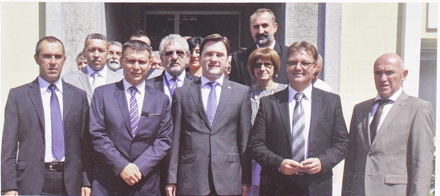
ПРВО ПРИЈЕМ У ОПШТИНИ - Група ВИП гостију

-Поента свега је да се у српској пољопривреди мора значајније улагати у веће прерадне капацитете, како би се добило што више производа, а корист била значајнија.