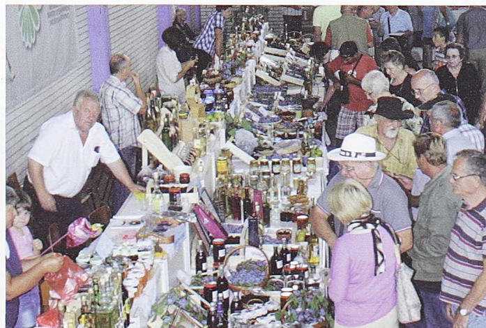
ЛЕПЕЗА ПРОИЗВОДА - Будућност шљиварства је у даљој преради

- Учестале све веће суше намећу питање наводњавања. То је веома важно, посебно за сорте средње и позније доба сазревања, јер утиче на обезбеђивање високих и квалитетних приноса. Воћарима препоручујем да проређују цветове као нову меру за добијања крупнијих и уједначенијих плодова. То је битно код стоних сорти, али и код оних које се користе за сушење.