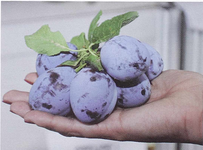
ЗАХТЕВА ПРОПИСАНУ НЕГУ - Дуг пут до доброг рода и квалитетног плода

Тему: „Нови трендови у туризму као начин ревитализације села” разрадио је Сектор за туризам Министарства привреде и финансија. Компанија „Irrigation” из Београда имала је презентацију о узгајању боровнице, док је Регионална развојна агенција АРРОКО - Лајковац представила свој програм подршке предузетништву и, такође, привукла пажњу гостију, посетилаца и учесника Сајма.