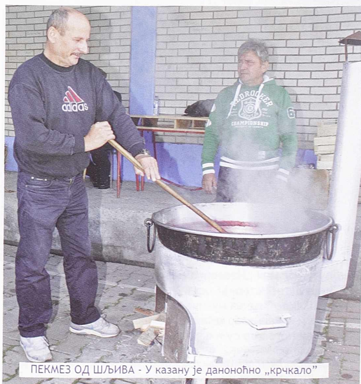
ПЕКМЕЗ ОД ШЉИВА - У kazanу је даноноћно „крчкало”

Он је још нагласио да његове радове карактерише слобода изражавања за коју се изборио, али и одговорност према свима онима који су му помогли или то још увек чине да уметнички делује.